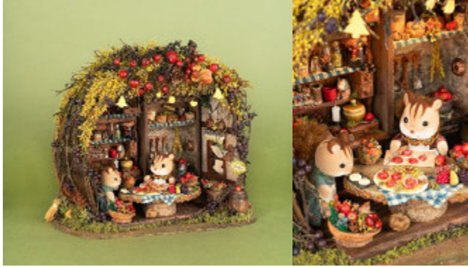
工藤和代「おいしさ作るしあわせ暮らし」