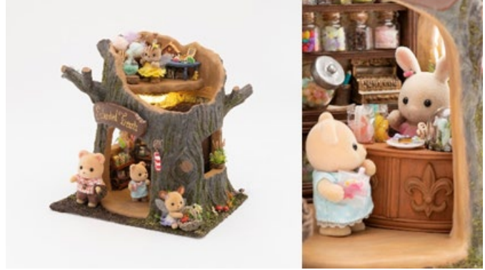
灰みみ「妖精さんの不思議なお菓子屋さん」