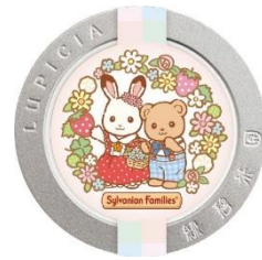
▲ルピシア オリジナルティー