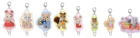
▲つながるアクリルチャームコレクション