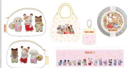
左から、西園寺さん部屋、レストランコラボ、本展覧会オリジナルグッズのイメージ

2024年に放送されたTBSドラマ「西園寺さんは家事をしない」では、主人公の西園寺さん（演：松本若菜）が大好きな「シルバニアファミリー」に囲まれるお部屋が話題となりました。本展覧会では、その「西園寺さん部屋」を一部再現し、展示いたします。西園寺さんのアクリスタンドも登場し、テレビドラマから派生した「シルバニアファミリー」の広がりを体感できるスポットです。