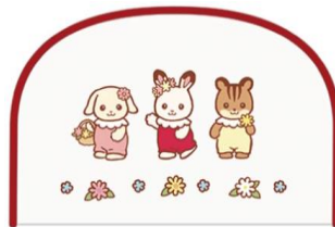
▲サガラ刺繍ポーチ