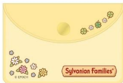
▲クリアポーチ付きフレックシール