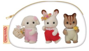
▲赤ちゃんダイカットポーチ