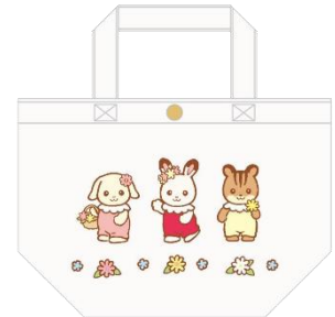
▲サガラ刺繍ランチトートバッグ

※「エクセレント ドレスアップセット」はおひとり様3つまで、「ラグジュアリードレスペアセット」はおひとり様1つまでご購入いただけます。その他商品にも、購入個数制限を設ける場合があります。