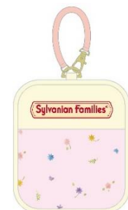
▲クリア窓付ポーチ