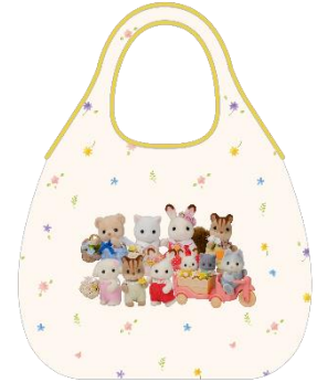
▲ポケットブルエコバッグ