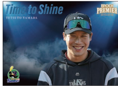
TIME TO SHINE